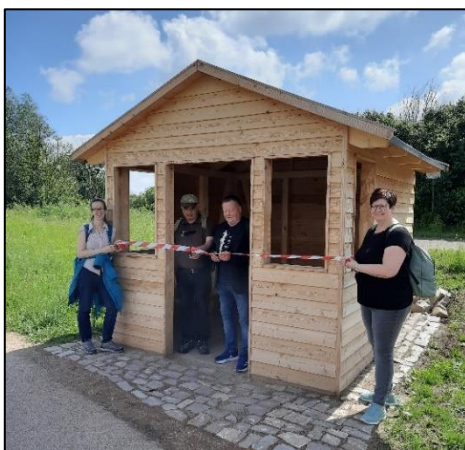
Einweihung der Schutzhütte in Plötzkau

Am 25. Mai versammelten sich die Mitglieder unseres Naturparks im Haus der Vereine in Plötzkau zur diesjährigen Mitgliederversammlung , auf der auch die Neuwahl des Vorstandes erfolgte. Im Anschluss wurde die im Dezember neu errichtete Schutzhütte zu Füßen des Schlosses Plötzkau offiziell eingeweiht. Die anschließende Naturpark-Frühlingswanderung führte Wanderfreunde und Naturinteressierte durch die interessante Landschaft des Plötzkauer Auwaldes.