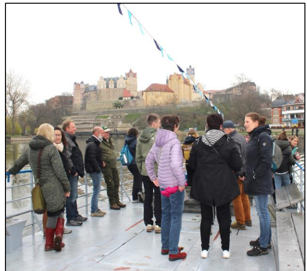
Fährfahrt auf der Saale in Bernburg

das zweite, diesmal von unserem Naturpark organisierte Treffen der Naturparke Sachsen-Anhalts , unser sogenanntes „ Familientreffen “, fand in diesem Jahr am 21. März statt. Die aus den Naturparks Fläming, Dübener Heide und Harz angereisten Teilnehmer wurden im Rahmen einer geführten Wanderung, einer Fährfahrt auf der Saale und der Besteigung des berühmten Keßlerturmes mit der reizvollen Auenlandschaft vor den Toren der Stadt Bernburg vertraut gemacht. Ein kreativer und fachlich fundierter Gedankenaustausch in gemütlicher Runde im Bernburger Restaurant „La Casa“ rundete das Programm ab.