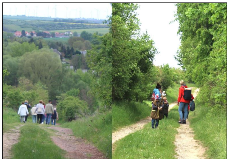
Kleine Frühjahrswanderung für Groß und Klein

Im Rahmen dieser Kooperation leitete ein Mitarbeiter unseres Naturparks die kleine Frühjahrs-wanderung des Museums , die