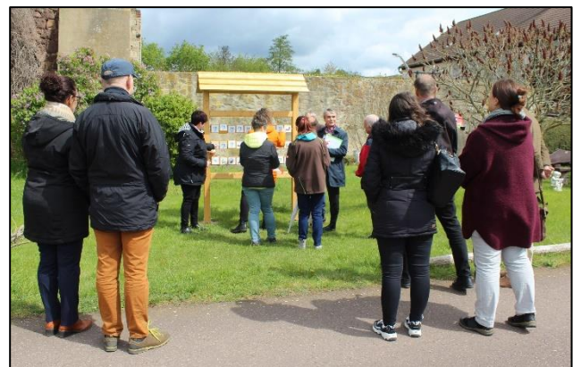
Einweihung des Naturparkmemorys

Für 2024 hat der Naturpark Unteres Saaletal e.V. die Sprecherrolle für die Naturparke Sachsen-Anhalts übernommen. Die diesjährige Klausurtagung der Naturparke Sachsen-Anhalts mit Dr. Steffen Eichner, Staatssekretär im Ministerium für Wissenschaft, Energie, Klimaschutz und Umwelt des Landes Sachsen-Anhalt, fand deshalb am 25. April in Mücheln bei Wettin statt. In diesem Rahmen wurde das am Ortsausgang Mücheln befindliche und aus Mitteln der vom Land Sachsen-Anhalt unterstützten Pflege und Entwicklungskonzeption finanzierte Naturparkmemory , als neuem Element der Bildung für nachhaltige Entwicklung eingeweiht.