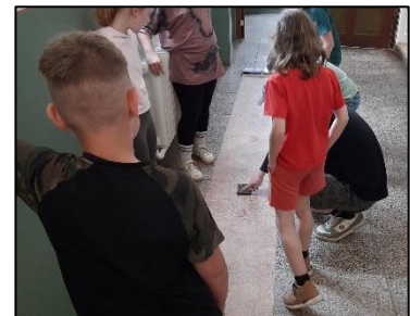
Spurenlesen in der Goetheschule

Am 22. Mai konnten rund 30 Hortkinder der Bernburger Grundschule „Johann Wolfgang von Goethe“ während der Schulferien mehrere durch den Naturpark geplante und durchgeführte Spiel-Stationen mit den Schwerpunkten Naturerfahrung und -erkundung sowie Artenschutz, besuchen, bei denen der WWF-Artenschutzkoffer zum Einsatz kam.