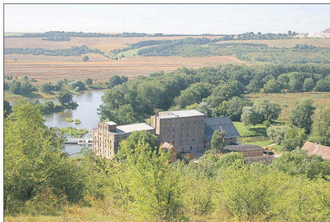
Pögritzmühle Wettin

Am Pfingstmontag, dem 20. Mai 2024 gab es wieder großes Interesse die Pögritzmühle in Wettin zu besichtigen. Der Kulturverein Wettin e.V. hatte dazu auch in diesem Jahr ein buntes Programm zusammengestellt. Neben dem Besuch des technischen Denkmals, konnten sich die Gäste an der Ausstellung „Junge Kunst in alten Mauern“ in der ersten Etage des Mühlenspeichers erfreuen. Diese Ausstellung wurde von der 11. Klasse im Spezialzweig Kunst erstellt. Zukünftig schmückt sie die Wände im Kunstbereich des Burg-Gymnasiums. Eine historische Wäscherolle aus Holz lud Besucherinnen und Besucher ein, mitgebrachte Weißwäsche wie in alten Zeiten mangeln zu lassen. Neben Bratwurst, Kuchen, frisch geräucherter Fisch, Honig und Getränken gab es für Groß und Klein auf dem Hof Interessantes zu entdecken.