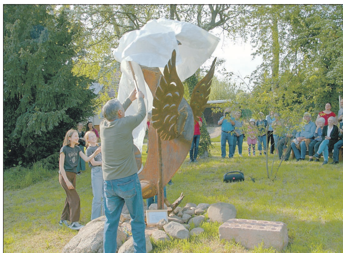
Die Hülle fällt feierlich

Der Förderverein Dorfkirche Deutleben e.V.